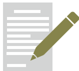
手書きの売上帳 のコピー