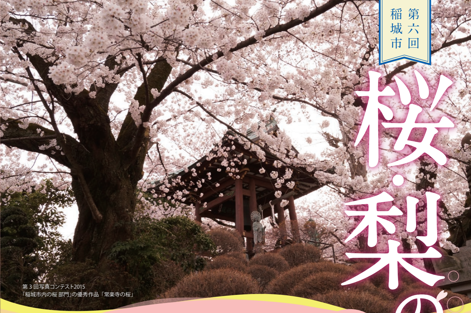
第3回写真コンテスト2015 「稲城市内の桜部門」の優秀作品「常楽寺の桜」